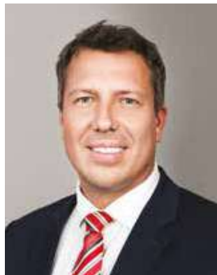
Tomáš Navrátil primátor statutárního města Opavy